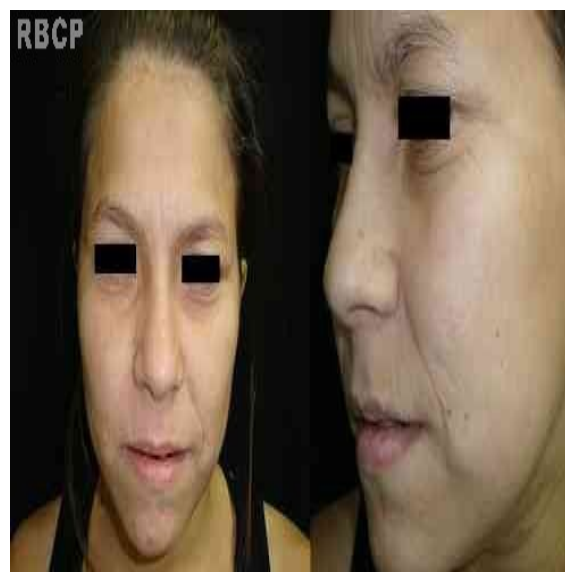
Figura 5 - Pós-operatório de 24 meses.