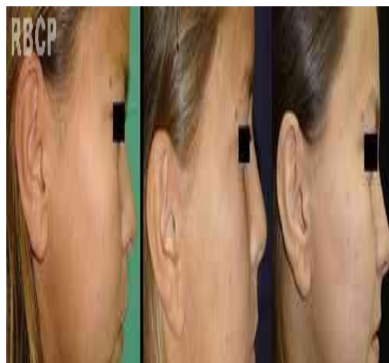
Figura 4 - Paciente em perfil no pré-operatório, pós-operatório de 6 meses e 24 meses respectivamente, evidenciando a evolução da cicatriz.

No acompanhamento pós-operatório de dois anos, as cicatrizes, como esperado, continuavam de boa qualidade (Fig. 4), entretanto, observou-se recorrência parcial da flacidez cutânea (Fig. 5). Paciente e familiares ficaram muito satisfeitos com o resultado. A equipe cirúrgica, entretanto, percebeu limitação do resultado cirúrgico. Talvez esta afecção mereça complementação mais intensa com tratamentos auxiliares como peelings e similares.