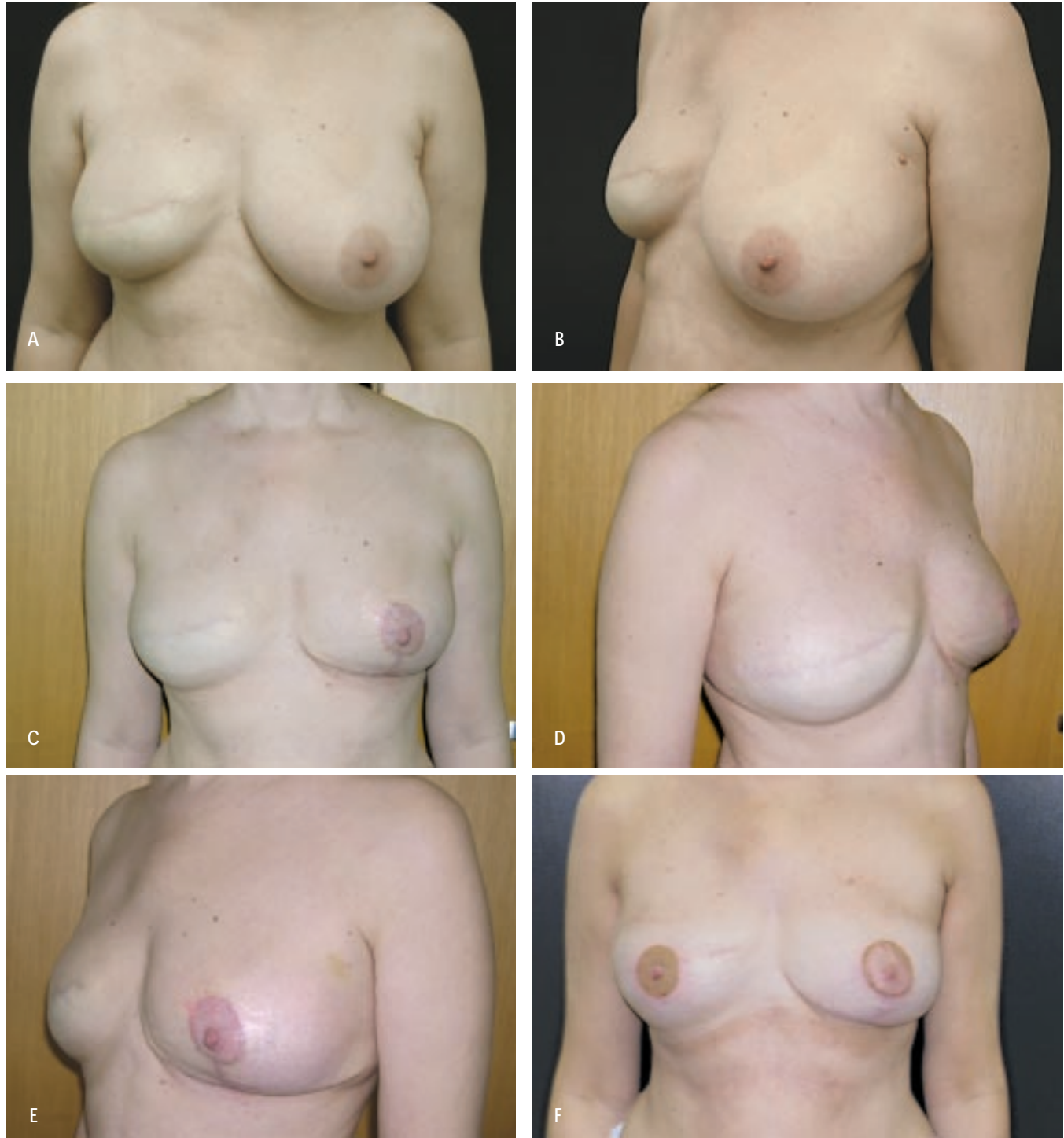
Figura 1 - A: pós-operatório de reconstrução de mama direita com expansor permanente; expansão completa. Visão frontal. B: pós-operatório de reconstrução de mama direita com expansor permanente; expansão completa. Visão lateral esquerda. C: pós-operatório de reconstrução de mama direita com expansor permanente; expansão completa e mamoplastia de simetrização. Visão frontal. D: pós-operatório de reconstrução de mama direita com expansor permanente; expansão completa e mamoplastia de simetrização. Visão lateral direita. E: pós-operatório de reconstrução de mama direita com expansor permanente; expansão completa e mamoplastia de simetrização. Visão lateral esquerda. F: pós-operatório de reconstrução de mama direita com expansor permanente; expansão completa, mamoplastia de simetrização e reconstrução do CAM (resultado final). Visão frontal.