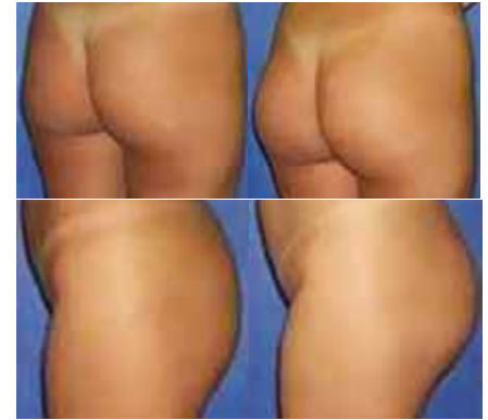
Figura 3 – Pré e Pós-operatório. Paciente, 26 anos. Prótese: Quartzo Oval 350 ml.

descolamento do subcutâneo para exposição adequada do glúteo máximo foi realizado imaginando-se um semicírculo originado na linha média, com cerca de 8 cm de raio. A fáscia glútea foi incisada em 6 cm, no sentido das fibras musculares e o plano intramuscular divulsionado de forma romba com pinça Duval, até 3 cm de profundidade, inicialmente em um ponto 2 a 3 cm lateral à borda sacral. Foi introduzido o descolador em direção lateral até o trocânter maior femoral, sendo este o limite lateral da loja do implante. Foi feito então descolamento no sentido médio-cranial, até a proximidade da crista ilíaca em um ponto 6 cm lateral à espinha ilíaca pósterio-superior; e caudal, até o túber isquiático, representado pela marcação cutânea transversa realizada no pré-operatório, para confecção de loja