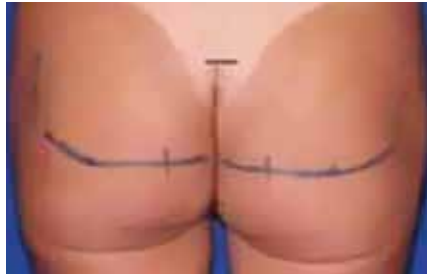
Figura 1 – Marcação dos limites superior da incisão cutânea e inferior do descolamento intramuscular.

De 2001 a 2010, foram operados 14 pacientes usando o método a seguir descrito. A idade destes variou de 25 a 50 anos (média: 32 anos), sendo apenas 2 homens. Hipoplasia glútea. Foram usados implantes específicos para a área glútea. Em 3 casos, utilizou-se próteses lisas redondas; em 6, texturizada oval, e próteses Quartzo® (modelos ovais de alta projeção) foram usadas nos 5 últimos casos, com o volume dos implantes variando de 250 a 500 ml (média de 350 ml). Pré-operatoriamente, o paciente foi marcado em dois momentos: na posição em ortostase foi traçado o limite superior do sulco interglúteo, indicando o início da incisão cutânea; em seguida, com o paciente sentado, foi traçada uma linha transversa em cada glúteo ao nível da base do isquão, correspondendo ao local onde o paciente apóia seu peso enquanto nesta posição, passando a representar o limite inferior do descolamento intramuscular. A incisão cutânea em fuso estreito (média de 6 cm de comprimento e 0,5 cm de largura) respeitou estritamente o sulco interglúteo do paciente. Foi feita a desepitelização do fuso, para confecção de ilha dérmica central com preservação do ligamento sacrocutâneo, e a incisão foi aprofundada lateralmente até a fáscia glútea. O