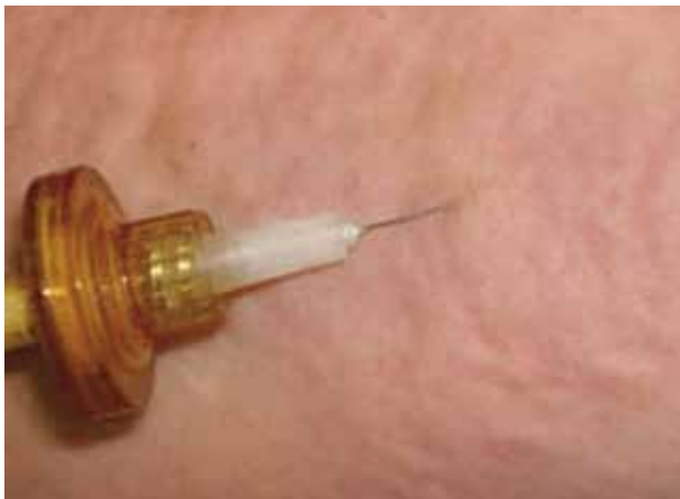
Figura 1 – Ondulações na superfície da pele causadas pela distensão da derme, acompanhada por hiperemia após a infusão controlada do CO 2 medicinal.