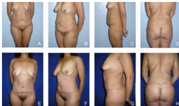
Figura 2 - Fotografias pré e pós-operatórias de paciente submetida a abdominoplastia circunferencial composta (ACC).