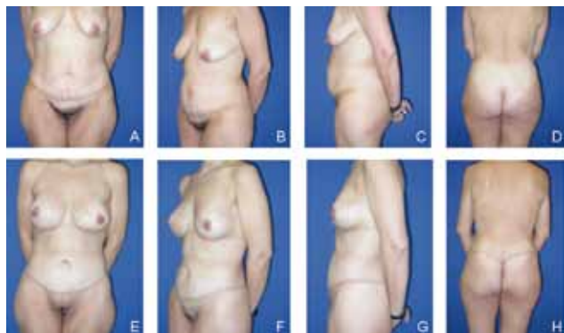
Figura 1 - Fotografias pré e pós-operatórias de paciente submetida a abdominoplastia circunferencial simples (ACS).

O critério adaptativo foi escolhido como princípio norteador da escala diagnóstica - EDAO, e a adaptabilidade foi apreciada segundo dois setores de funcionamento: afetivo-relacional e produtividade. A EDAO possibilitou fazer avaliação quantitativa a partir das respostas obtidas na avaliação qualitativa, por meio das notas que foram atribuídas. Os indicadores dos setores afetivo-relacional e produtividade, que estão relacionados entre si, tiveram uma avaliação que foi a soma das duas notas. A avaliação quantitativa dos dois setores possibilitou a classificação diagnóstica dos pacientes