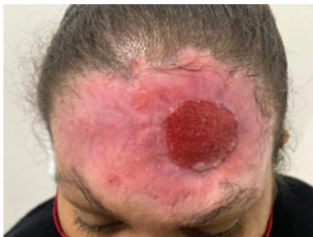
Fig. 3 Ferida completamente granulada após duas sessões de lipoenxertia

evidencia a ► Figura 3 . Posteriormente, foi realizado enxerto de pele de espessura total para cobertura do tecido de granulação, com área doadora proveniente da região inguinal.