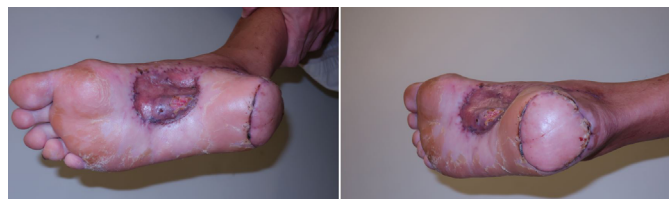
Figura 2. Resultado pós-operatório, com resultado funcional e estético adequados.

medial foi suficiente para as coberturas cutâneas das áreas ressecadas. Em todos os casos foi realizada a enxertia de pele parcial na área doadora do retalho.