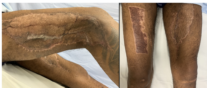
Figura 4. Aspecto das feridas no pós-operatório tardio. Houve completa reabilitação motora.

O paciente apresentou ótima integração de enxerto, recebendo alta hospitalar uma semana após a cirurgia, com acompanhamento ambulatorial das equipes de Cirurgia Plástica e Fisioterapia. Seguimento pós-operatório tardio evidenciou completa reabilitação motora (Figura 4).