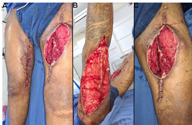
Figura 2. A - Aspecto das feridas após 4º desbridamento em centro cirúrgico. B - Região posterior do membro inferior direito. C - Ferida em coxa esquerda.