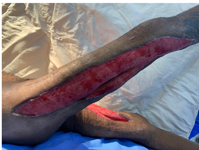
Figura 3. Feridas com leito granuloso e sem sinais de infecção.

Optou-se pela realização de enxerto de pele parcial retirado com dermatomo elétrico, utilizando como doadoras as áreas íntegras nos próprios membros inferiores e realização de curativo oclusivo não aderente.