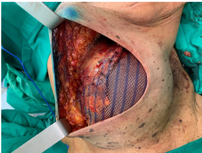
Figura 2. Intraoperatório, mama esquerda com tela UltraPro® 15x15cm fixado superiormente ao peitoral maior (já dissecado) e fixado inferior/lateralmente à fáscia muscular do reto abdominal e serrátil anterior, respectivamente.