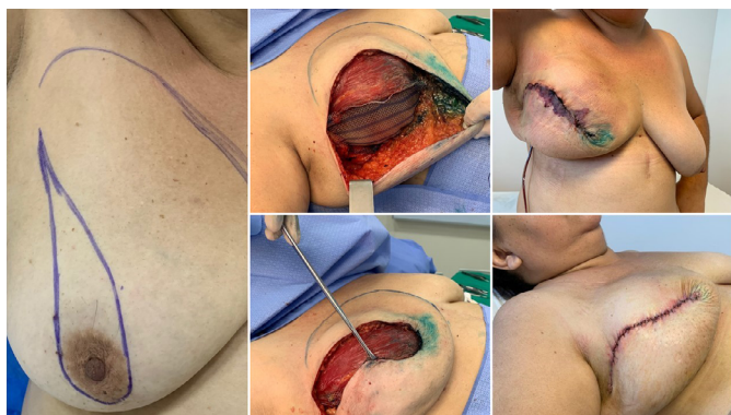
Figura 4. Reconstrução mamária com prótese de silicone texturizada, redonda (450cc) + tela UltraPro® 15x15cm. Evoluiu com necrose marginal de bordos do retalho cutâneo da mastectomia. Ressutura após 21 dias de pós-operatório.

seguimento médio de sete meses, pacientes com idade média de 49 anos, IMC de 24kg/m 2 . Em 38 pacientes (25,7%) houve seroma no pós-operatório, atribuído ao maior número de pacientes submetidas às ressecções alargadas de pele e/ou abordagem cirúrgica da axila. Em 21 pacientes (14,2%) houve complicações hemorrágicas, em 21 pacientes houve infecções cutâneas, em 20 pacientes (13,5%) houve alterações na vascularização do retalho cutâneo (Figura 4).