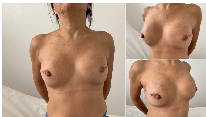
Figura 5. Tríplice (30°) pós-operatório de reconstrução mamária bilateral com prótese de silicone texturizada redonda, perfil alto (325cc) e tela UltraPro® 15x15cm cada.

Bonomi et al. (2019) 18 realizaram um estudo retrospectivo (2014 a 2016) com 56 pacientes que apresentavam média acentuada de hipertrofia e ptose mamárias, e foram submetidas à reconstrução mamária imediata (após mastectomia) através de uma incisão cutânea em T invertido, na Itália. Utilizaram um retalho dérmico desepitelizado sobre a bolsa submuscular e tela sintética absorvível Vicryl® a fim de protegê-los de uma eventual necrose cutânea local. A reconstrução foi unilateral em 50 pacientes com mamoplastia oposta em 45 pacientes. A idade média das pacientes era de 47 anos, IMC de 23,8kg/m 2 . O volume médio das próteses de silicone foi de 520g e houve uma média de 20 dias de utilização de dreno de sucção no pós-operatório. Figuras 5, 6 e 7. Dezesesseis (16) pacientes apresentaram maiores complicações, sendo que 8 pacientes apresentaram necrose parcial do retalho cutâneo da mastectomia. Não houve relato de perda do implante de silicone.