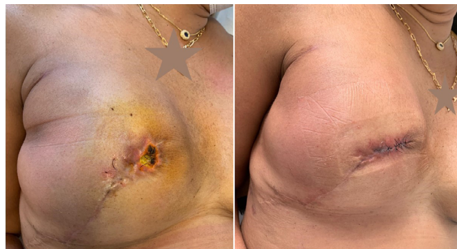
Figura 3. Necrose cutânea em extremidade distal de cicatriz (30° PO). Ressutura após desbridamento. Apresentou "síndrome red breast" no quadrante inferior externo.

Gschwantler-Kaulich et al. (2016) 10 realizaram estudo prospectivo com 48 pacientes, divididas em 2 grupos; 25 pacientes submetidas à reconstrução mamária com tela sintética inabsorvível (Tilooop ® ) e 23 pacientes utilizaram ADM de origem porcina (Protexa ® ). A idade média foi de 48 anos e o índice de massa corpórea (IMC): 24kg/m 2 . Diferentes incisões cirúrgicas foram utilizadas: inframamária: 14 pacientes, em T invertido: 16 pacientes, periareolar ou raquete de tênis: 18 pacientes. Houve 9 complicações no grupo de ADM (3 seromas, 3 infecções, 2 deiscências em cicatrizes cirúrgicas: T invertido e 1 paciente com síndrome da mama vermelha) (Figura 3).