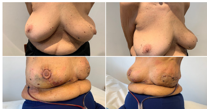
Figura 6. Paciente 78 anos, 5° pós-operatório de mastectomia esquerda e reconstrução com prótese texturizada redonda 525cc e tela UltraPro® 15x15cm + mamoplastia redutora contralateral.