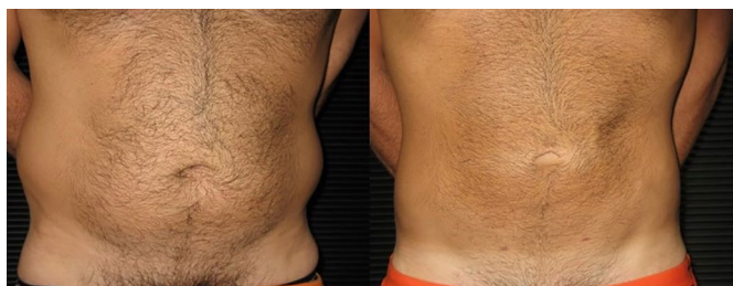
Figura 3. Paciente masculino (vista anterior).