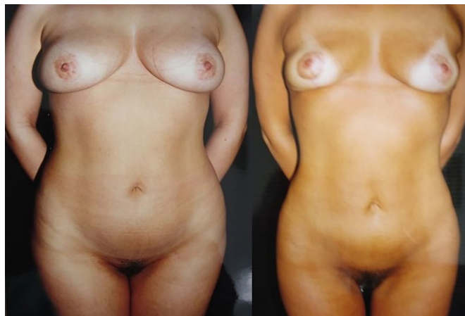
Figura 1. Paciente feminina (vista anterior).

cirúrgica, além de permitir a lipoenxertia imediata. Refere que nos casos analisados obteve um alto índice de satisfação, adequada simetria e ausência de irregularidades. Abaixo demonstramos alguns casos do autor nos quais utilizou-se a técnica de lipoescultura com seringa. (Figura 1 a 4)