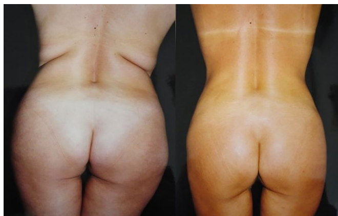
Figura 2. Paciente feminina (vista posterior).