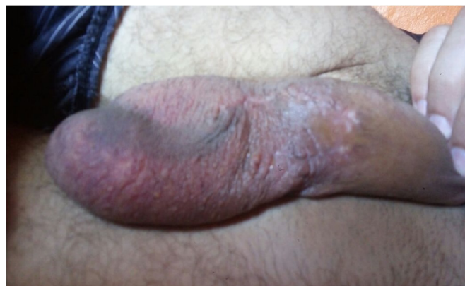
Figura 2. Resultado de ressecção com fechamento primário dos nódulos calcificados com 6 meses de pós-operatório.

Paciente apresentou boa evolução cirúrgica e sem intercorrências. Obteve resultado estético satisfatório (Figura 2) e não demonstrou alterações funcionais.