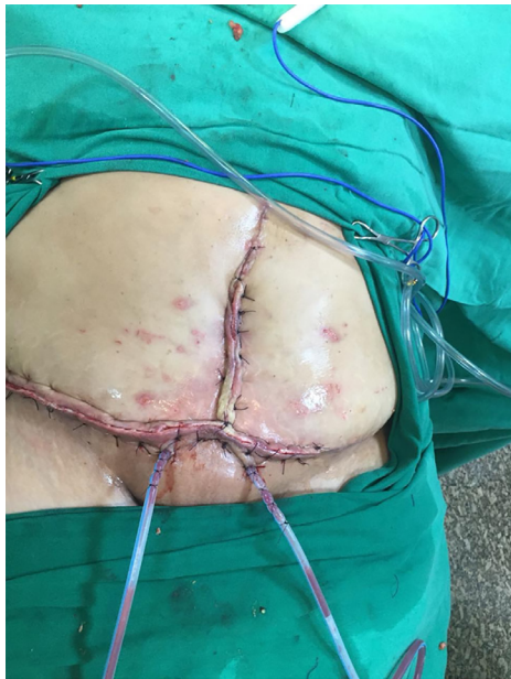
Figura 5. Resultado final após desbridamento.

Na sequência da reabordagem, foi iniciado meropenem, por seis dias, a seguir, com resultados da cultura de tecido necrótico e de tela, cresceu Pseudomonas aeruginosa , foi modificado para ciprofloxacina até o final da internação. Iniciou sessões de terapia hiperbárica para melhoria da infecção e cicatrização. No dia 1 de março de 2019, a paciente realizou tomografia de abdome, devido não melhora clínica total, a qual evidenciou coleções no tecido subcutâneo em região de fossa ilíaca direita (88 mL) e epigástrica (13 mL), foi realizada drenagem guiada por ultrassom. Após, a paciente evoluiu com melhora clínica e laboratorial recebendo alta hospitalar estável.