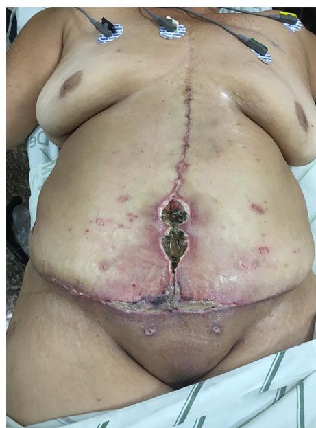
Figura 4. Infecção de ferida operatória.