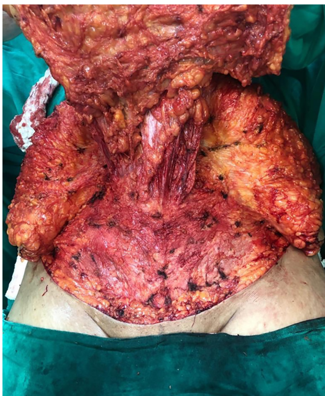
Figura 2. Descolamento de retalho e visualização de grande hérnia.

No décimo dia pós-operatório, a paciente retornou ao consultório médico para revisão apresentando pequena infecção em ferida operatória, na região infraumbilical, onde foi modificado esquema de antibiótico para amoxicilina com clavulanato de potássio. No 14º dia pós-operatório, a paciente foi admitida em caráter de urgência devido à infecção de ferida operatória, apresentando extensa deiscência de sutura associada a grande infiltração necrótica em região epigástrica e hipogástrico, e insuficiência renal aguda (Figura 4). Foram realizados desbridamento cirúrgico, lavagem abundante com soro fisiológico e antibiótico (gentamicina, clindamicina), mantida tela de polipropileno, colocação de dreno JVac®, encaminhadas culturas de tela e tecido, fechamento primário de ferida (Figura 5).