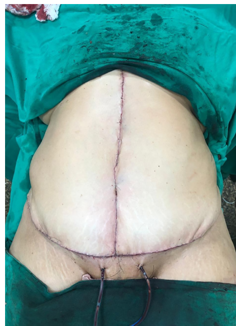
Figura 3. Resultado final da dermolipectomia sem tensão de retalhos.

No perioperatório, a equipe de cirurgia plástica descolou retalho dermatogorduroso até cicatriz umbilical; na sequência, a equipe de cirurgia geral realizou reparação da hérnia incisional com colocação de tela de polipropileno (Figuras 2 e 3). A paciente evoluiu bem no pós-operatório, recebeu alta no dia 11 de fevereiro 2019 com recomendação de uso de enoxaparina e cefadroxila profilática, ambas durante sete dias.