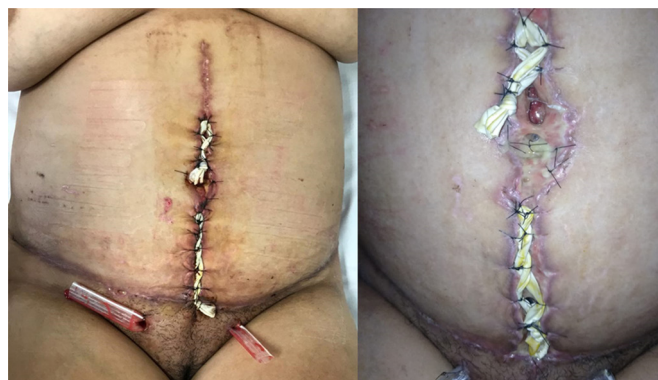
Figura 6. A: Aspecto 14 dias após sutura elástica; B: Em detalhe.

Sete dias depois, apresentava deiscência de parte da sutura elástica, mantendo áreas de perda de continuidade na ferida operatória e necrose do coto da cicatriz umbilical (Figura 6). Foi, então, submetida a novo debridamento com reavivamento das bordas e resutura. Optamos por reconfeccionar a sutura elástica sobre a ferida suturada, com o objetivo de manter a tração contínua nas bordas e tentar prevenir nova deiscência. Em posição correspondente à cicatriz umbilical necrosada, foi deixada área cruenta para que, cicatrizando por segunda intenção, pudesse haver retração e formação de nova cicatriz. Este procedimento foi realizado em caráter ambulatorial.