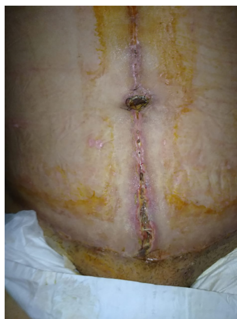
Figura 3. Aspecto no 13º DPO - em uso de rifamicina tópica.

Após sete dias, no 13º DPO, entrou em contato telefônico com equipe referindo piora, com perda da continuidade da ferida cirúrgica. Relatava deiscência superficial em grande parte da incisão vertical, incluindo cicatriz umbilical (Figura 3).