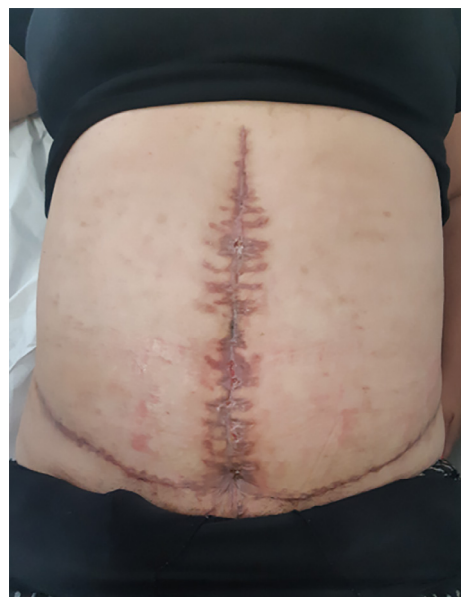
Figura 7. Aspecto da FO no último contato com a paciente - 90º DPO da dermolipectomia para correção de cicatriz abdominal.

Passados mais 15 dias, a paciente já estava com ferida cicatrizada, sem área cruenta, mas começou a apresentar retração em região suprapúbica, além de hipertrofia da cicatriz vertical (Figura 7), com grande insatisfação com aspecto estético da cicatriz.