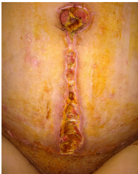
Figura 4. 19º DPO (foto enviada pela paciente).