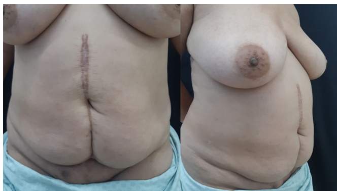
Figura 1. Aspecto pré-operatório.

Paciente foi orientada quanto à perda de peso para melhora do resultado estético (apesar de a intervenção programada ter primordialmente intenção reconstrutora), cessação de tabagismo e controle/manutenção do tratamento psiquiátrico, para definição do momento cirúrgico.