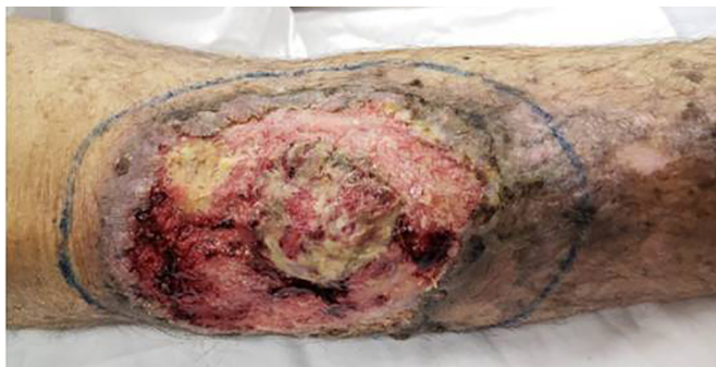
Figura 1. Características clínicas do CEC na região superior da perna direita.

Paciente masculino, 67 anos de idade, natural de Florianópolis, Santa Catarina, com antecedente de transplante renal há 31 anos, terapia imunossupressora com prednisona e azatioprina, hepatite C tratada com daclatasvir e sofosbuvir durante 2 anos, apresenta lesão tumoral há 9 meses com crescimento acelerado, de bordas irregulares, odor fétido, localizada no terço superior da perna direita. Diâmetro de lesão de 15 cm × 10 cm, com centro ulcerado e necrótico, com sangramento ocasional (Figura 1). Dor intensa associada, sem evidência clínica de linfonodos inguinais, pulsos normais, deambulação normal. Resultado anatomopatológico prévio à cirurgia reporta carcinoma de células escamosas invasivo, moderadamente diferenciado. O paciente foi submetido a ressecção total da lesão com margens de segurança de 1 cm e reconstrução com retalho fásio-cutâneo e enxerto de pele total.