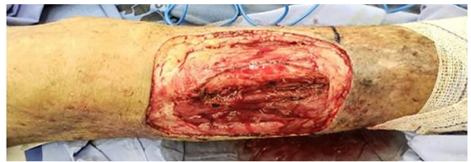
Figura 2. Aspecto após ressecção tumoral, com evidente exposição óssea.

Procedeu-se à incisão e à dissecação do retalho fásio-cutâneo na panturrilha direita para cobertura do defeito ósseo. Realizou-se cuidadosa hemostasia com bisturi elétrico e procedeu-se à fixação do retalho com pontos simples com PDS 3-0. Após, captou-se enxerto de pele no abdome inferior, que então recebeu preparo com aparelho skin graft mesher (Figura 4), e foi fixado à zona receptora com sutura com PDS