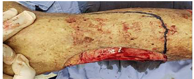
Figura 3. Marcação do retalho fásio-cutâneo.