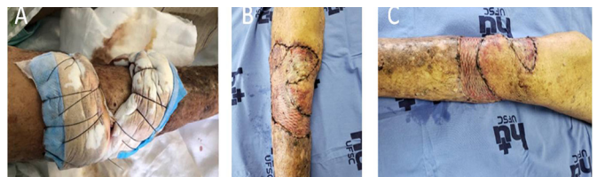
Figura 5. A: Curativo de Brown para estabilização do enxerto de pele total; B: Aspecto no 5º dia pós-operatório; C: Aspecto no 10º dia pós-operatório.

O paciente mantém acompanhamento no ambulatório de cirurgia plástica sem queixas, e é orientado a fazer hidratação da pele com AGE (óleo de girassol) três vezes ao dia e evitar