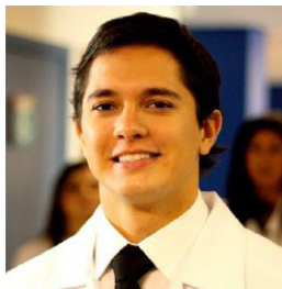
LEONARDO MILANESI POSSAMAI 1,2*

FLAVIO MACIEL DE FREITAS NETO 1,2 BRUNO BLAYA BATISTA 1,2 NÍVEO STEFFEN 1,2 PEDRO BINS ELY 1,2