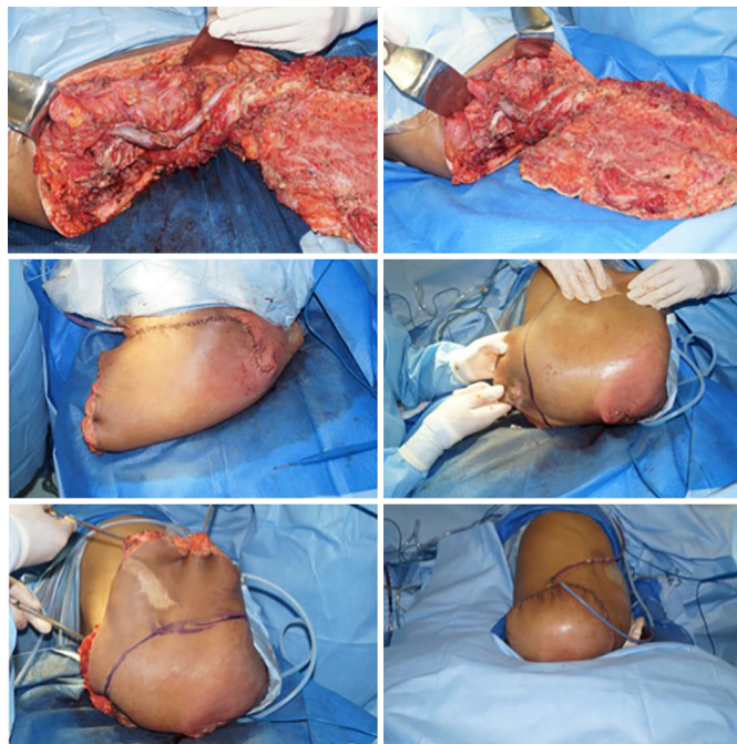
Figura 4. Fechamento.

enfermaria, se alimentando oral, referindo estar satisfeito com resultado cirúrgico. Como complicação o mesmo apresentou coleção de 80 ml abaixo do retalho, feita drenagem guiada por tomografia e retirada dos drenos anteriores. Houve perda de continuidade de epiderme e derme parcial em sutura de aproximadamente 6 cm, sem necessidade de intervenção (Figura 5).