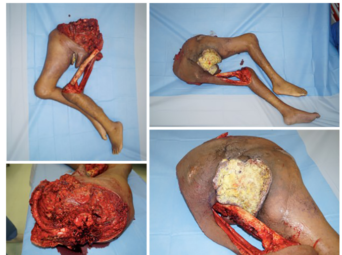
Figura 3. Desarticulação.