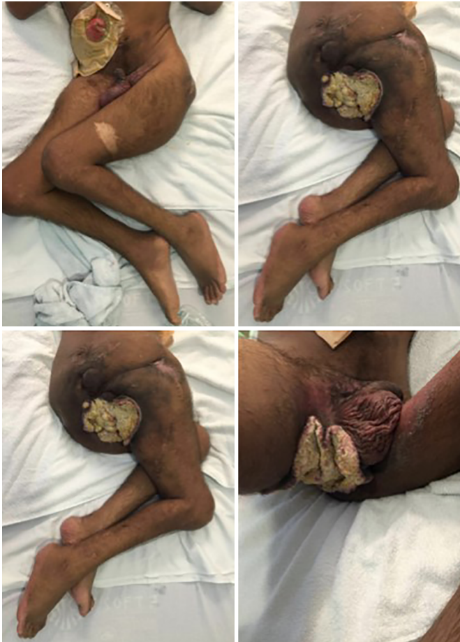
Figura 1. Pré-operatório.

foi seccionada e a artéria femoral profunda ligada após emissão dos ramos vasculares da coxa (Figura 2).