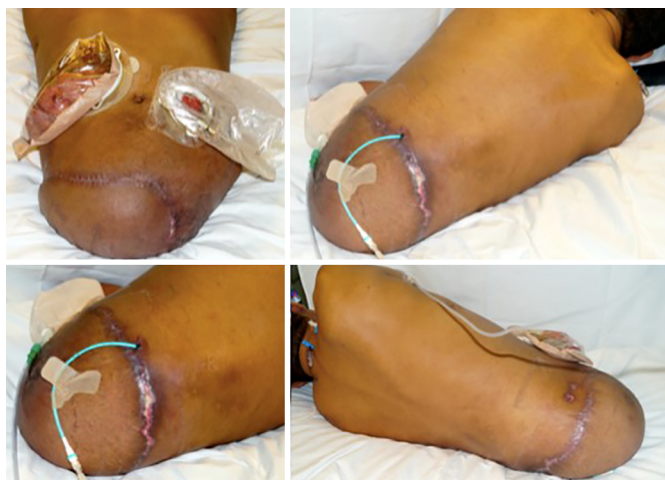
Figura 5. Pós-Operatório.

enfermaria, se alimentando oral, referindo estar satisfeito com resultado cirúrgico. Como complicação o mesmo apresentou coleção de 80 ml abaixo do retalho, feita drenagem guiada por tomografia e retirada dos drenos anteriores. Houve perda de continuidade de epiderme e derme parcial em sutura de aproximadamente 6 cm, sem necessidade de intervenção (Figura 5).