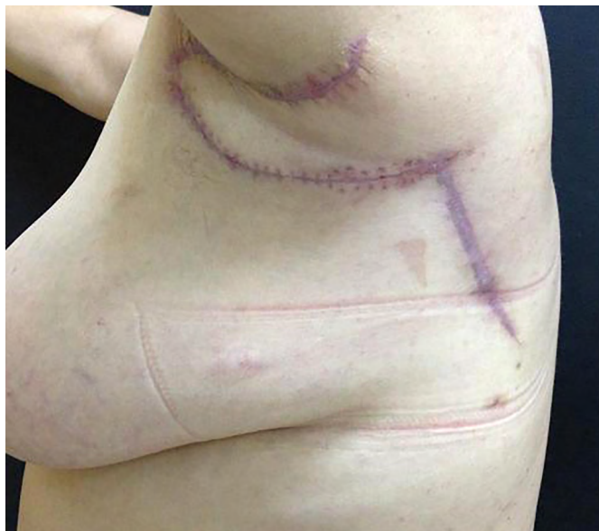
Figura 4. Pós-operatório da cobertura do defeito axilar e a área doadora do retalho paraescapular esquerdo.