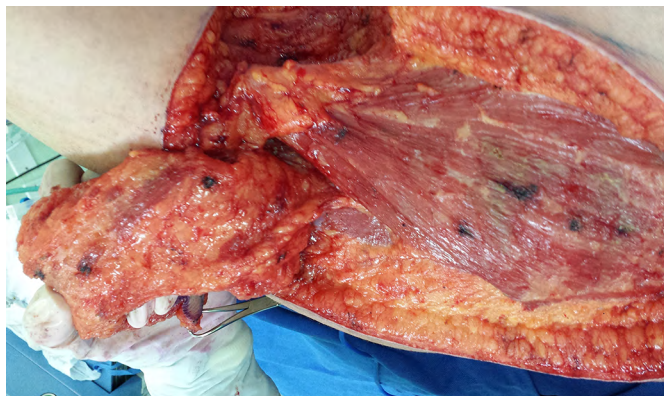
Figura 8. Vista do pedículo do retalho paraescapular direito.