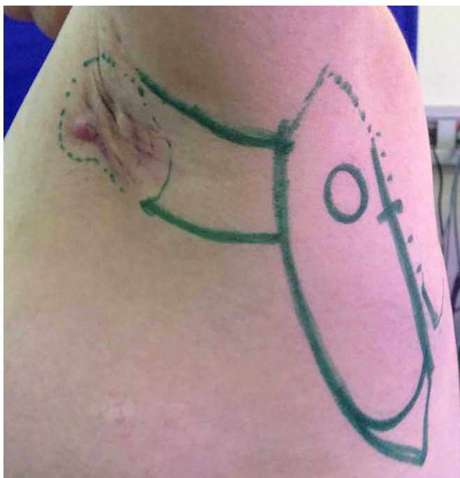
Figura 2. Planejamento ressecção e retalho paraescapular, com identificação do espaço triangular esquerdo.

A cirurgia foi realizada sob anestesia geral, com as pacientes em decúbito lateral, com delimitação macroscópica da área comprometida com HS, incluindo 2 cm além da área pilosa como margem a ser ressecada, limitando a margem profunda à fáscia muscular. Os tecidos foram enviados para estudo anatomopatológico e cultura de tecidos.