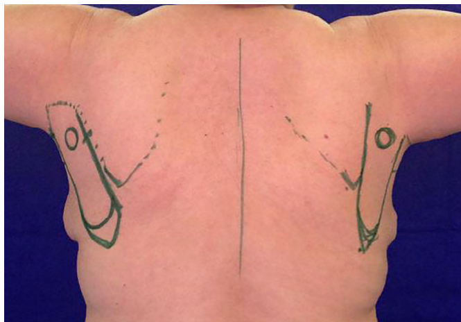
Figura 3. Visão posterior com o planejamento dos dois retalhos paraescapulares.

Foi realizada a reconstrução imediata da axila, com cobertura do defeito cutâneo com retalho paraescapular de transposição ipsilateral, com síntese do leito axilar receptor e da área doadora no dorso com mononylon 3-0 e 4-0 em três planos. Foram utilizados drenos de sucção tubular na área doadora e na axila de 15F, com retirada com débito inferior a 30 ml/24hs.