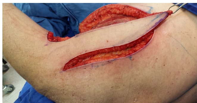
Figura 6. Retalho paraescapular à direita dissecado.

Descrito em 1982 16 , o retalho paraescapular é um retalho fasciocutâneo baseado no ramo descendente da artéria circunflexa da escápula, ramo da subescapular, que pode ser utilizado como retalho pediculado ou livre, por ter um pedículo seguro e confiável. Ele se localiza na porção lateral da escápula, propicia cobertura a extensos defeitos e sua área doadora consegue ser fechada primariamente. É a nossa escolha na reconstrução de defeitos axilares com hidradenite supurativa crônica por possuir semelhanças de coloração, textura e espessura da pele entre as áreas doadora e receptora (Figuras 6 a 8).