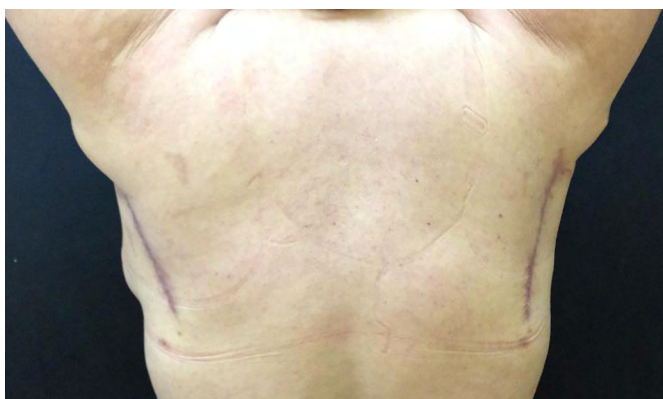
Figura 5. Visão posterior da área doadora dos retalhos paraescapulares, com abdução total dos membros superiores.

na borda pilosa ou radical, que consiste numa margem de 2 cm a partir da borda pilosa e aprofundando-se até fásia muscular 10 . A HS axilar, quanto ao emprego de uma ressecção radical, possui a menor taxa de recorrência, variando de 0 a 3% 10-12 .