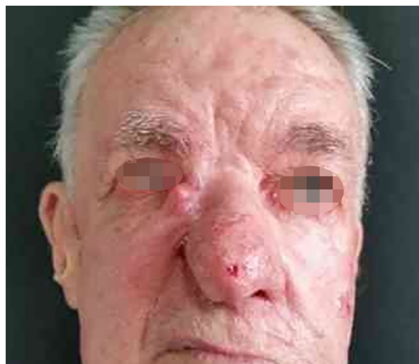
Figura 4. Carcinoma basocelular nasal - pré-operatório. Paciente com extensa lesão recidivada em parede nasal lateral, ponta nasal e região malar direita - aspecto da lesão no pré-operatório.

A Tabela 1 resume os pacientes selecionados de acordo com idade, etiologia, localização anatômica do defeito e número de cirurgias realizadas.