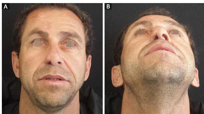
Figura 3. Resultado tardio com desobstrução nasal e paciente apresentando melhora no padrão respiratório. A: Visão anterior; B: Visão basal.

Todos os enxertos cartilagosos secundários se integraram ao leito receptor. Não houve casos de extrusão ou reabsorção cartilaginosa. Não houve nenhum caso de infecção ou hematoma. Houve um caso de necrose cutânea parcial junto à reconstrução da columela, com cicatrização completa por segunda intenção após cuidados locais e curativo diário. Uma paciente apresentou recidiva do tumor, alcançando assoalho de órbita (apesar de exame de congelação realizado durante a exérese mostrar margens cirúrgicas livres) e recusou novo procedimento cirúrgico que envolveria exenteração de órbita.