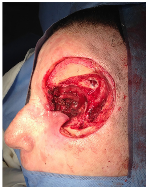
Figura 8. Carcinoma basocelular nasal orbital - defeito resultante.

Infelizmente, por questões oncológicas, o restabelecimento da cavidade anoftálmica permitindo o reparo protético não foi uma opção nos casos apresentados, sendo a preocupação principal apenas o fechamento dos defeitos cutâneos.