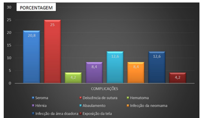
Figura 1 - Distribuição do percentual de complicações pós-operatórias.

As complicações pós-operatórias mais frequentes foram deiscência de sutura (25%) e seroma (21%), conforme demonstrado na Figura 1.