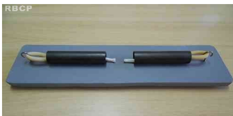
Figura 2 - Simulador montado, com os tendões suínos já posicionados.