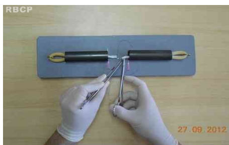
Figura 4 - Realização da tenorrafia com fio de náilon.