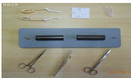
Figura 1 - Simulador de tenorrafias e material necessário para a prática das suturas.

in vivo . O suporte de madeira, os parafusos "em gancho" e os tubos de PVC, além de fácil montagem, apresentaram baixo custo. A avaliação da eficácia do treinamento é subjetiva e difícil, sugerindo-se o uso de protocolo com múltiplas variáveis a serem avaliadas, preferencialmente, por um cirurgião experiente. Entretanto, notou-se um incremento subjetivo no grau de segurança dos residentes e acadêmicos que realizaram o treinamento, principalmente no que diz respeito à técnica da sutura.