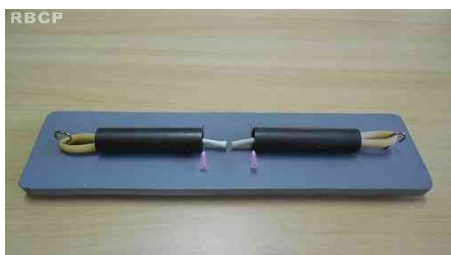
Figura 3 - Tendões transfixados por agulhas, prontos para sutura.