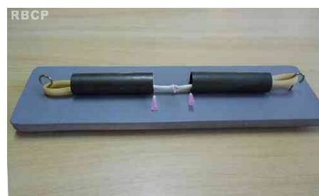
Figura 6 - Aspecto final do simulador, após sutura.