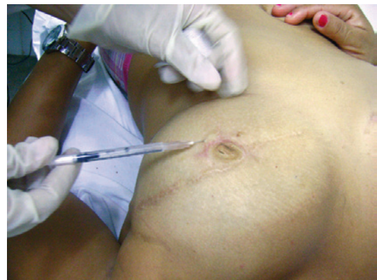
Figura 5 – Anestesia local realizada após antisepsia com solução alcoólica.