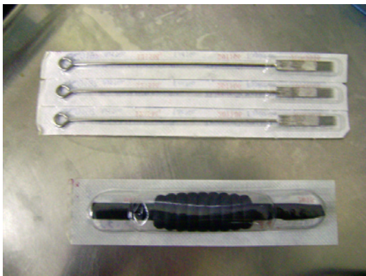
Figura 2 – Agulha e biqueira descartáveis.