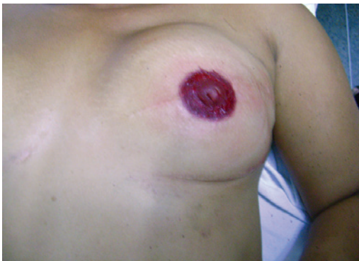
Figura 6 – Resultado imediato após o procedimento, observando-se equimose e sangramento dérmico.

Desse total, 9 foram submetidas a reconstrução imediata com retalho miocutâneo transverso do reto abdominal e uma a aposição de expansor temporário seguida de troca posterior por prótese mamária subpeitoral.