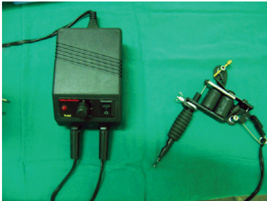
Figura 1 – Máquina elétrica para realização de tatuagem definitiva artística.

com lidocaína 2% com vasoconstritor (Figura 5). Assim, o procedimento tornou-se mais confortável para a paciente e o sangramento dérmico resultante foi de menor intensidade, facilitando a visualização dos pigmentos utilizados (Figura 6).