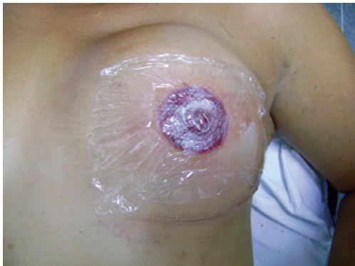
Figura 7 – Curativo com pomada cicatrizante e filme de policloreto de polivinila.

Previamente à confecção do CAP, 5 pacientes foram submetidas a simetrização da mama contralateral. As cores utilizadas foram tons de chocolate e marrom nas aréolas mais escuras a negras, e rosa, pele e marrom claro nas pacientes caucasianas (Tabela 1).