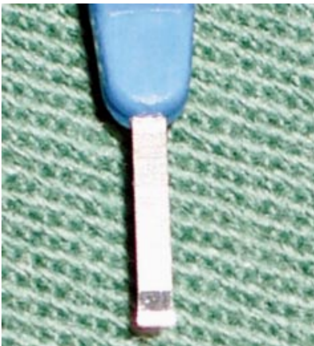
Figura 2A - Lâmina cirúrgica minde com a ponta reta.