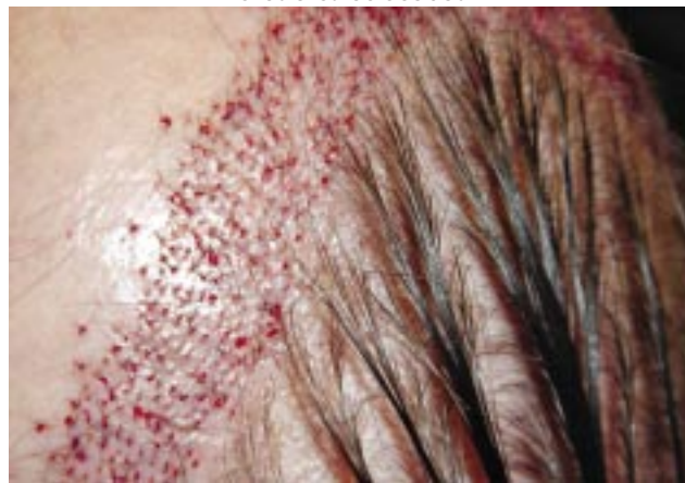
Figura 6B - Detalhe de incisões coronais com as unidades foliculares colocadas.