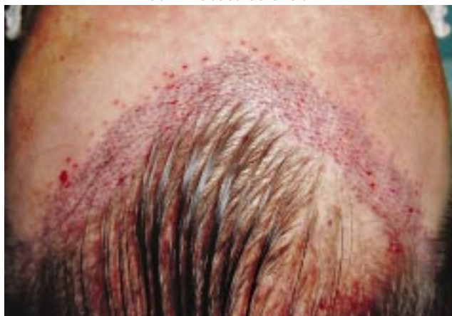
Figura 3B - Detalhe de região anterior com incisões coronais.