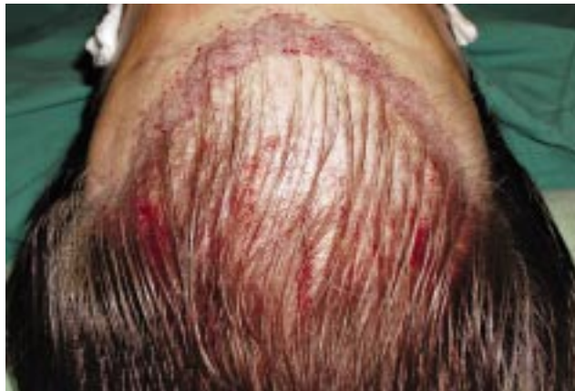
Figura 3A - Linha anterior e centímetro posterior a esta confeccionadas com incisões coronais.