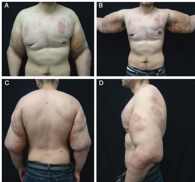
Figura 1. Pré-operatório: Lesões expansivas caracterizadas como massas e nódulos firmes e irregulares no subcutâneo aderidos e de uma coloração violácea na pele em membros superiores e tórax. A: Visão anterior. B: Vista anterior com membros superiores abduzidos. C: Visão posterior. D: Visão de perfil esquerdo.

Paciente masculino, 33 anos, referia ter iniciado aplicações de óleo mineral por indicação no ambiente da academia de ginástica. As aplicações seriadas se seguiram por 3 meses no tórax anterior e braços, sendo interrompidas há 2 anos. Alguns meses após o término das injeções, já apresentava lesões expansivas na região torácica anterior e braços, caracterizadas como massas e nódulos firmes e irregulares no subcutâneo aderidos a planos profundos; além de uma coloração violácea na pele acometida (Figura 1).