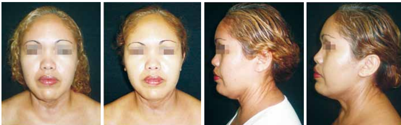
Figura 3 - Pré e pós-operatório de 8 meses.