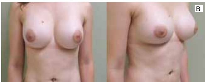
Figura 4 - Caso 2. A: Pré-operatório. B: Pós-operatório com 18 semanas de evolução.