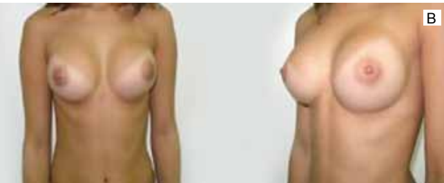
Figura 3 - Caso 1. A: Pré-operatório. B: Pós-operatório com 26 semanas de evolução.