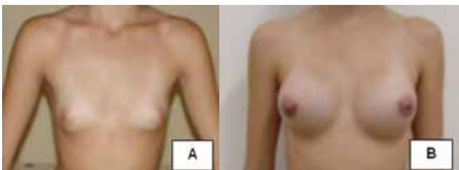
Figura 5 - Caso 3. A: Pré-operatório. B: Pós-operatório com 30 semanas de evolução.