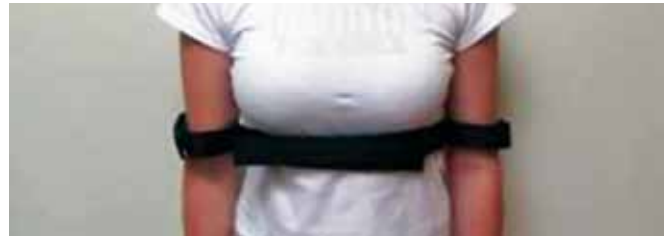
Figura 6 - Faixa contentora externa.

mamário suprajacente a ela, até os limites externos previamente marcados no tórax da paciente. Nesse passo, não houve o uso de eletrocautério ou qualquer outro método de hemostasia. Após a liberação, a loja assim confeccionada foi inspecionada com o uso de um afastador com fonte de luz e nenhum ponto de sangramento importante foi evidenciado. Os implantes de silicone foram, então, posicionados nesse espaço. O tecido mamário e a fáscia foram aproximados com pontos de nylon 3-0, separados. A subderme foi aproximada com pontos de nylon 4-0, separados, e a cirurgia foi finalizada com sutura intradérmica contínua de monocryl 4-0.