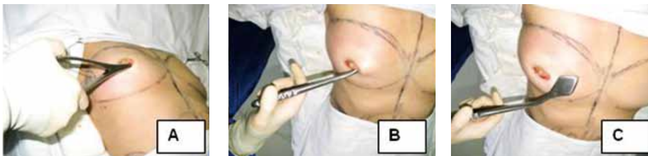
Figura 2 - Detalhe da técnica operatória. A e B: dissecação romba subfascial. C: descolador articulado.

O método anestésico utilizado mais comumente foi o bloqueio peridural torácico, associado a infiltração da mama e da região areolar com solução de xilocaína a 0,5% mais adrenalina 1/500.000 4,5 . Em alguns poucos casos, utilizou-se como método anestésico apenas a infiltração descrita 4 . Todas as pacientes foram submetidas a sedação